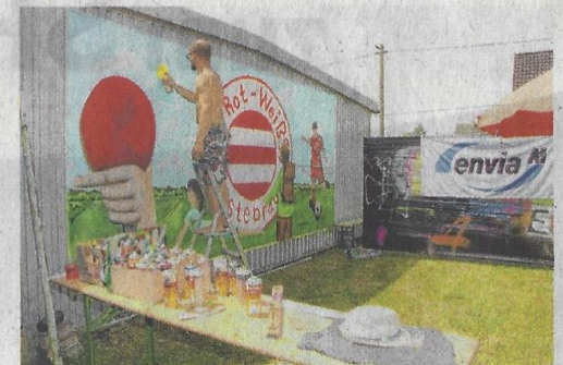
Ralf Hecht gestaltet ein neues Graffiti am Sportplatz in Kostebrau.

»envia M energie« AG hat dieses neue Graffiti finanziert - wie auch bereits im Vorfeld das Graffiti am Werkstattgebäude der Hospita Sozialdienste GmbH im Ort. Das neue, 2,20 Meter breite und 4,50 Meter lange Motiv am Sportplatz zeigt die fünf Sektionen der TSG Rot-Weiß 90 Kostebrau: Tischtennis, Volleyball, Gymnastik, Wandern und Fußball.