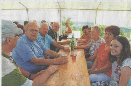
Das 11. Strassenfest fand an der Gemarkungsgrenze von Klettwitz und Kostebrau statt. Einwohner beider Orte feierten gemeinsam.

„Die Organisation dieses Festes ist immer beidseitig. Der Chef vom Sportverein Klettwitz und