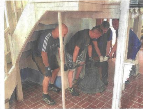
In der Kirche Gröden: Freiwillige Helfer aus Kostebräu kümmern sich um den Abtransport der alten Schulglocke.