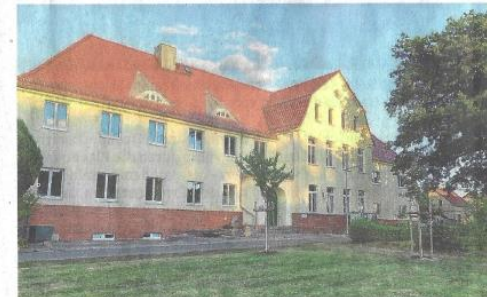
Die sanierte ehemalige Schule im Oberdorf von Kostebräu. Einst hatte die Schulglocke zum Unterricht gerufen.